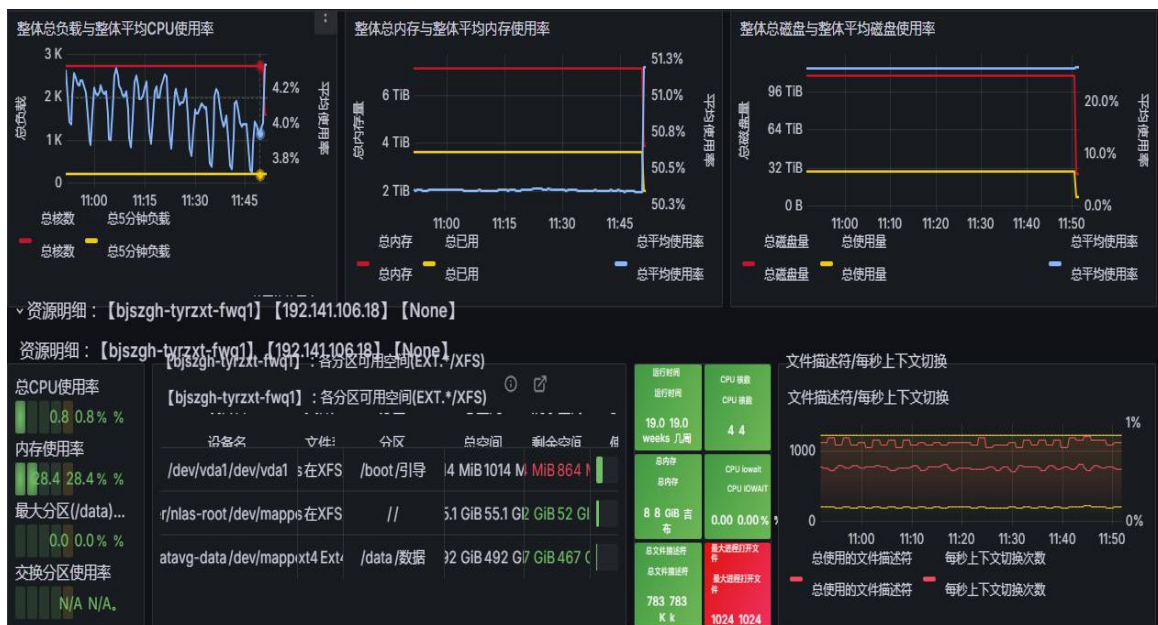
图 1 云主机深度监控、应用可用性监控截图